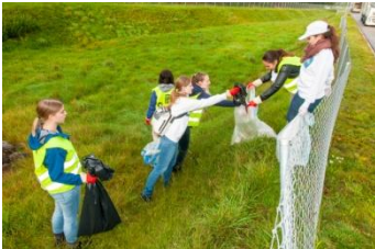
Clean-Up-Day 2014: In occasione di questi due giorni, i comuni, le associazioni, le scuole e le imprese liberano le strade dai rifiuti abbandonati.